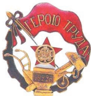
Рис. 2. Знак Героя Труда РСФСР Fig. 2. The sign of Labour Hero of RSFSR