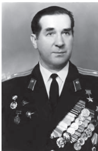
Рис. 5. Профессор Борис Александрович Самотокин (1915—1994) Fig. 5. Professor Boris Alexandrovich Samotokin (1915—1994)

Коновалов Александр Николаевич (рис. 8) — выдающийся нейрохирург, организатор здравоохранения, педагог; доктор медицинских наук (1970), профессор (1973), академик АМН СССР (1981), академик РАН (2000); Президент Ассоциации нейрохирургов России (с 2002), Почетный Президент Всемирной Федерации нейрохирургических обществ, член многих академий США, Европы и Азии. Лауреат Государственной премии СССР (1985), Государственных премий РФ (1995, 2006), премии Правительства РФ (2006). Директор НИИ нейрохирургии им. акад. Н.Н. Бурденко (1975—2014).