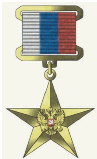
Рис. 7. Золотая медаль Героя Труда Российской Федерации Fig. 7. The gold medal of Labour Hero of Russian Federation