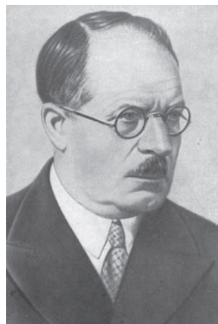
Рис. 3. Профессор Николай Нилович Бурденко (1878—1946) Fig. 3. Professor Nikolai Nilovich Burdenko (1878—1946)