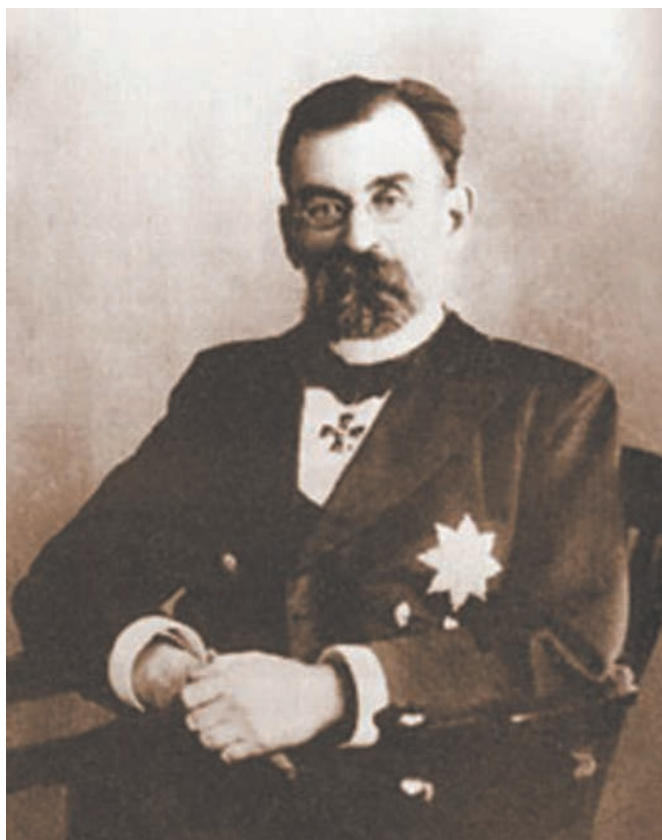
Рис. 1. Профессор Василий Иванович Разумовский (1857—1935) Fig. 1. Professor Vasilii Ivanovich Razumovskii (1857—1935)

Василий Иванович Разумовский (рис. 1) — крупнейший отечественный хирург и зачинатель